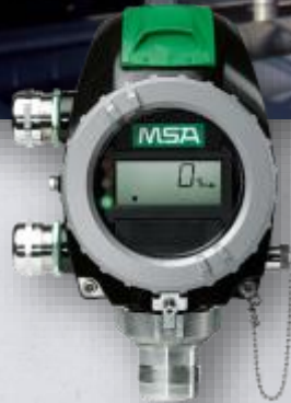
PrimaX P Transmissor de Gás