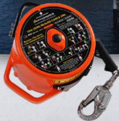
Latchways Selado Trava Quedas Resgatador