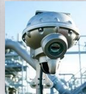
OBSERVER-i Detector de Gás Ultrassonico