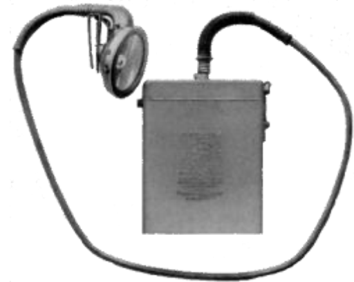
Lâmpada MSA para Capacete