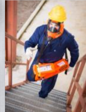
PremAire® Escape Dispositivo Respiratório