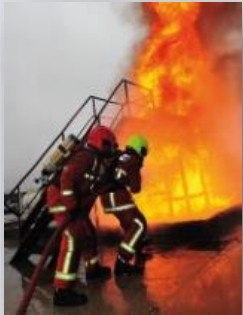
Capacete para Bombeiro e Máscara Autônoma