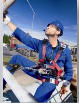
Proteção Contra Quedas e Proteção à Cabeça