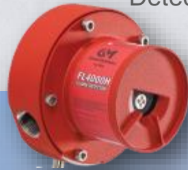
FL4000H Detector de Chama