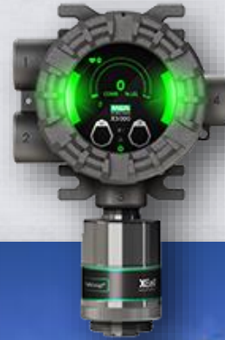
ULTIMA® X5000 Detector de Gás