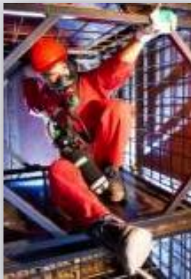
PremAire® Combination Respirador