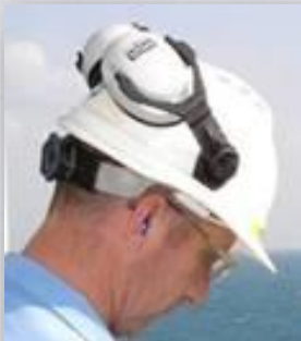
Proteção à Cabeça e Auditiva