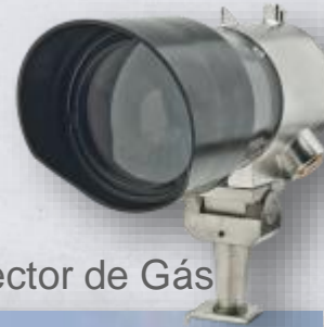
IR5500 Open Path – Detector de Gás