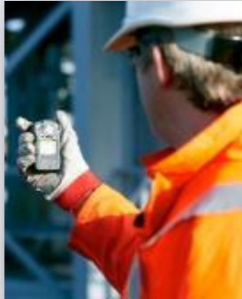
ALTAIR® 2X Detector de Gás